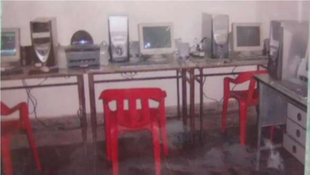
ACTUAL SALA DE INFORMATICA